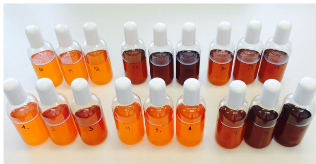
Olje produsert fra fersk og konservert innmat fra laks.

Økt lagring fører også til misfarging av oljen. Dette kommer av at oksidasjonsprodukter reagerer med proteinrester i oljen og danner fargede komponenter.